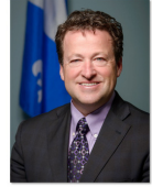
ASSEMBLÉE NATIONALE QUÉBEC

« Aujourd'hui plus que jamais, nous devons tous nous concerter pour protéger les services de santé de proximité, essentiels à la vitalité de nos collectivités et au bien-être de chacun de nos concitoyens ».